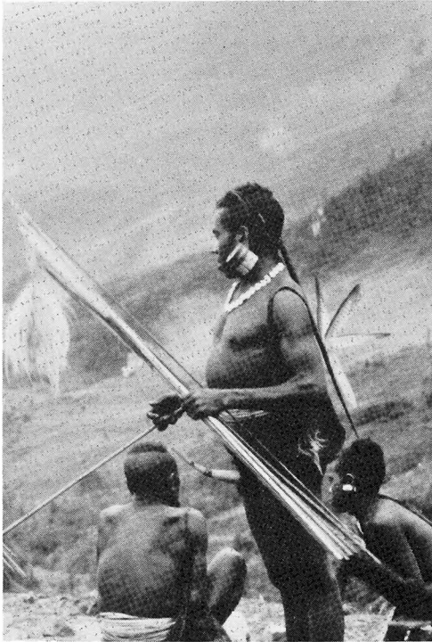
Abb. 3. BOITE von Kabcedama: Geschmückt zum Kampf bereit

rung durch die Amerikaner und die Administration der Indonesier über das Land kommen. In dieser rauen Bergwelt mit ihren meist glatten Steilhängen erweist sich die einfache Uhrwerk-Bolex (16 mm, mit leider nur 5 m Durchzug von 30-m-Spulen) als die von einem Einzelgänger am besten zu handhabende Kamera. Das dazugehörige Stativ