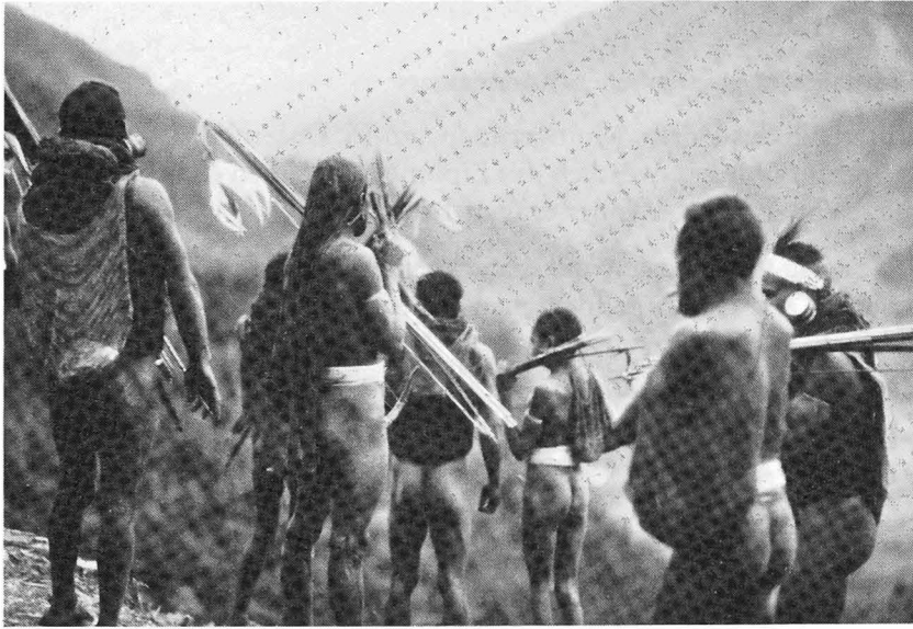
Abb. 4. Alarmierte Männer von Malingdam, geschmückt und bereit, dem Feind entgegenzueilen

zwangsweise zu einem „Mitlaufen mit der Kamera“. Es sind alles ungestellte, unbeeinflusste Aktivitäten. Nicht einmal ein Wechsel der Filmspule wird von den Akteuren abgewartet. Und doch sind, soweit unter meiner Kontrolle, die Arbeiten weitestgehend vollständig dokumentiert, wenn auch beim Hausbau leider die schon Wochen zuvor im Bergwald geschehene Gewinnung des Baumaterials notgedrungen fehlt.