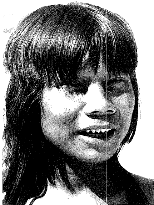
Abb. 3. Ein junger Krahó mit gespitzten Zähnen

Die Operation des Zahnanspitzens darf bei den Krahó offensichtlich jeder, der etwas davon versteht, ausführen.