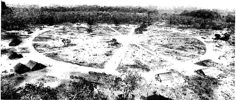
Abb. 1. Das Krahó-Dorf Pedra Branca im Jahre 1965. Die Häuser sind kreisförmig um einen zentralen Platz angeordnet

Die Namen der Dörfer werden von ihrer Lage und Umgebung bestimmt. So erhielt beispielsweise das Dorf Cachoeira seinen Namen von dem nahe gelegenen Wasserfall ( cachoeira = Wasserfall). Morro do Boi ist der Name einer Meseta (erodierter Hügel), während die anderen Dorfbezeichnungen identisch mit den Namen kleiner Flüsse sind. Wenn die Dörfer verlegt werden, was öfter geschieht, ändern sich häufig ihre Namen.