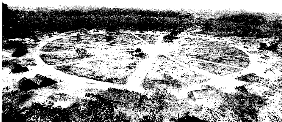
Abb. 1. Das Krahó-Dorf Pedra Branca im Jahre 1965. Die Häuser sind kreisförmig um einen zentralen Platz angeordnet

Die Namen der Dörfer werden von ihrer Lage und Umgebung bestimmt. So erhielt beispielsweise das Dorf Cachoeira seinen Namen von dem nahe gelegenen Wasserfall ( cachoeira = Wasserfall). Morro do Boi ist der Name einer Meseta (erodierter Hügel), während die anderen Dorfbezeichnungen identisch mit den Namen kleiner Flüsse sind. Wenn die Dörfer verlegt werden, was öfter geschieht, ändern sich häufig ihre Namen.