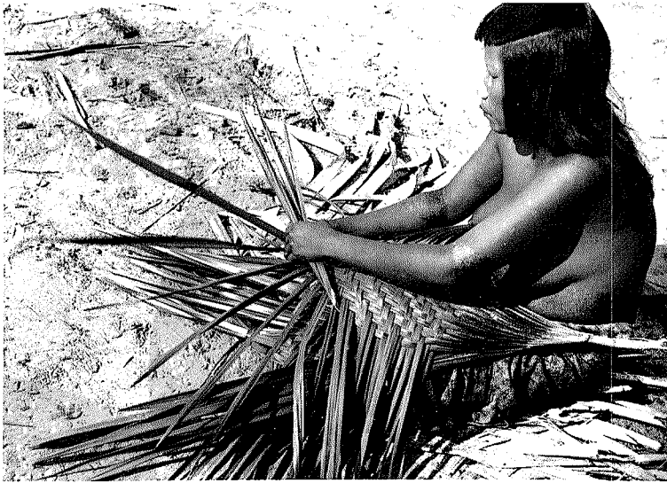
Abb. 3. Zusammenflechten der Hälften eines fächerförmigen Buriti-Palmblattes in 2/2 Körperbindung zur Herstellung eines Korbes