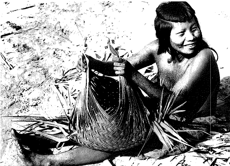
Abb. 4. Das halbfertige Geflecht wird in die gewünschte Form gebracht