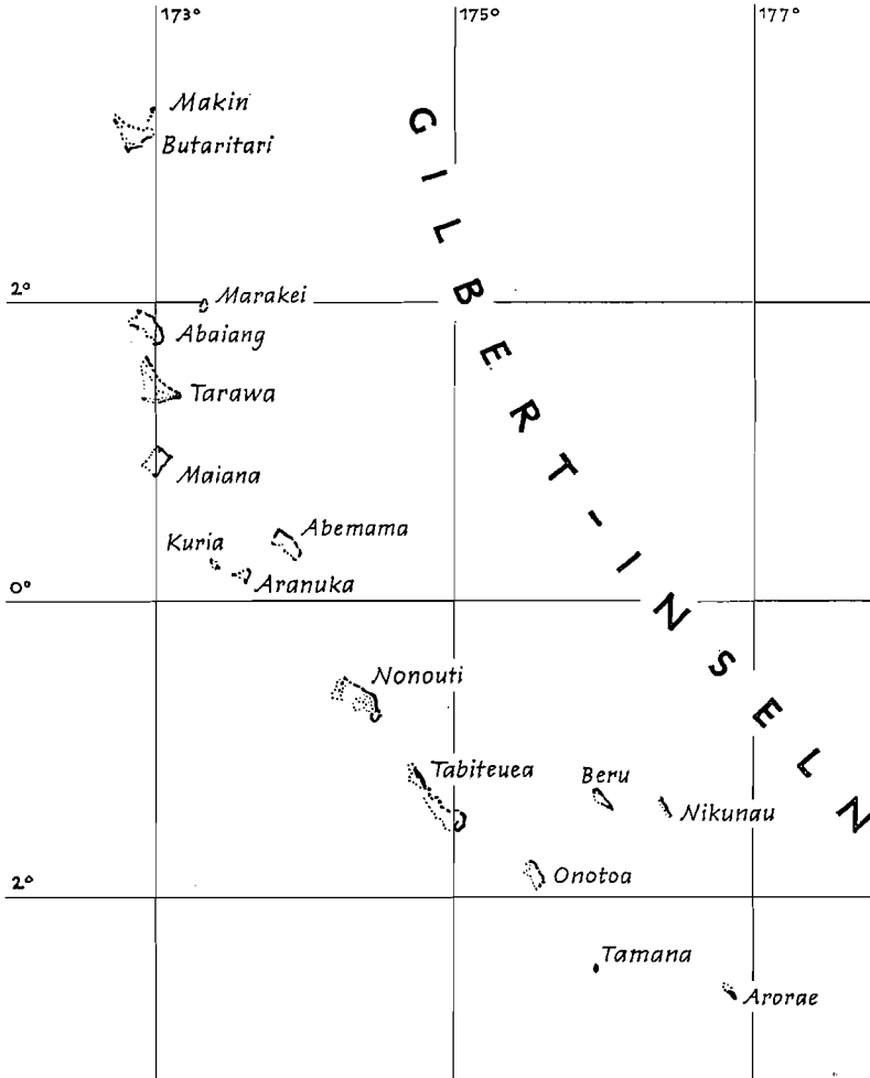
Abb. 2. Der Archipel der Gilbert-Inseln

Auf den südlichen Atollen des Archipels gab es kein Häuptlingstum. Die patrilokalen, patrilinearen, exogamen und totemistisch bestimmten Familienverbände, geführt von den alten Männern bzw. Sippenhäuptern, waren die größten politisch und wirtschaftlich autarken Einheiten.