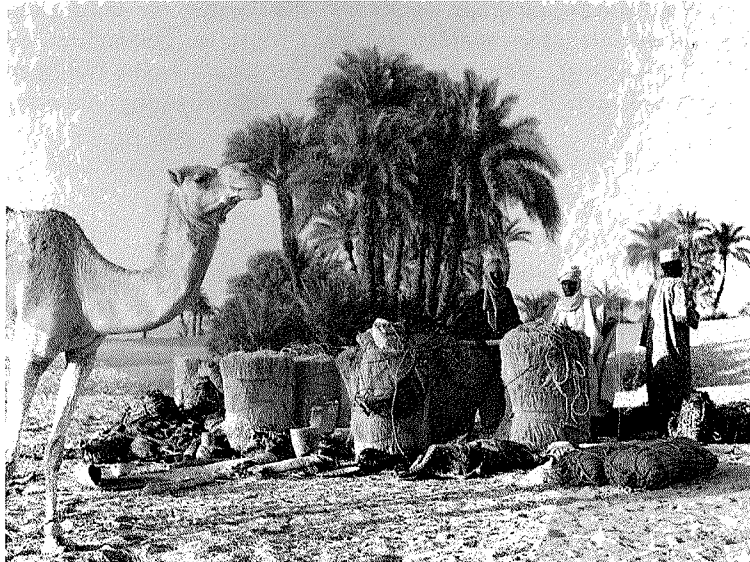
Abb. 5. Lager eines Tuareg auf dem Karawanenplatz

Frauen und Mädchen betreiben den Kleinhandel. Gegen kleine Salzbarren und lose Datteln ersehen sie, was für den Haushalt gebraucht wird (Tongefäße, Gewürze usw.).