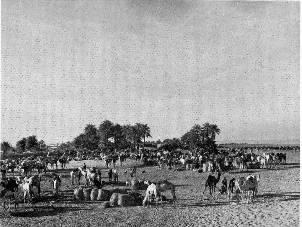
Abb. 4. Der Karawanenplatz von Fachi

kalten Nachtwind. Auf dem Karawanenplatz haben sich zahlreiche Männer und Frauen von Fachi eingefunden, um die ausgestellten Waren zu begutachten, Bekannte zu begrüßen, Geschäfte zu machen. Bei den Karawanentuareg sind nur Männer vertreten, das Gesicht mehr oder weniger mit dem Schleier bedeckt. Nach diesem einleitenden Überblick zeigt der Film verschiedene Typen des Handels zwischen Kanuri und Tuareg.