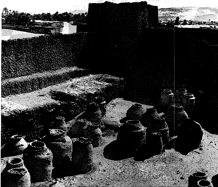
Abb. 3. Die Burg von Fachi. Im Burghof stehen die alten Speicher, von denen nur noch einzelne benutzt werden. Im Hintergrund eines der neuen Stadtviertel, die außerhalb der Stadtmauer entstanden

bei der Verpachtung von Gärten und Salinen eine wichtige Rolle spielt. Zwischen den beiden sozialen Schichten besteht ein Heiratsverbot, das jedoch infolge des zunehmenden Wohlstandes vieler tujana immer mehr durchlöchert wird. Als Sklaven werden nur jene Menschen eingestuft, die persönlich als Sklaven gekauft