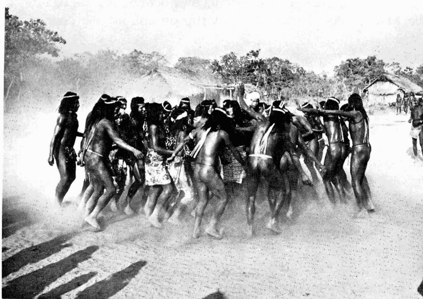
Abb. 3. Ein Tanzablauf auf der Rundstraße des Dorfes während des Piegré -Abschlußfestes

rufen die Hóg-Mitglieder heraus und gehen mit ihnen zusammen zum Haus der Krokrok. Sobald sie dort erscheinen, kommen die Krokrok-Männer heraus und tanzen um sie herum. Der Ablauf dieses Tanzes ist einfach. Während die Kiñaré bewegungslos und ernst in der Mitte stehen und auf den Boden sehen, gehen die Hóg anfangs singend