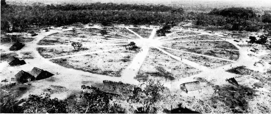
Abb. 1. Das Krahó-Dorf Pedra Branca im Jahre 1965. Die Häuser sind kreisförmig um einen zentralen Platz angeordnet

Als die Indianer noch unabhängig waren, hatten sie speziell in den zwei Jahrzehnten zwischen 1920 und 1940 ihre Ernteerträge so gesteigert, daß sie den Überschuß in Carolina, einer 200 km weiter nördlich gelegenen Stadt, verkaufen konnten. Doch nach dem Überfall durch die Viehzüchter wurden sie auf ihr heutiges Gebiet zurückgedrängt, zu dem der Wald an den Ufern des Rio Tocantins nicht mehr gehört. Damit hörte auch