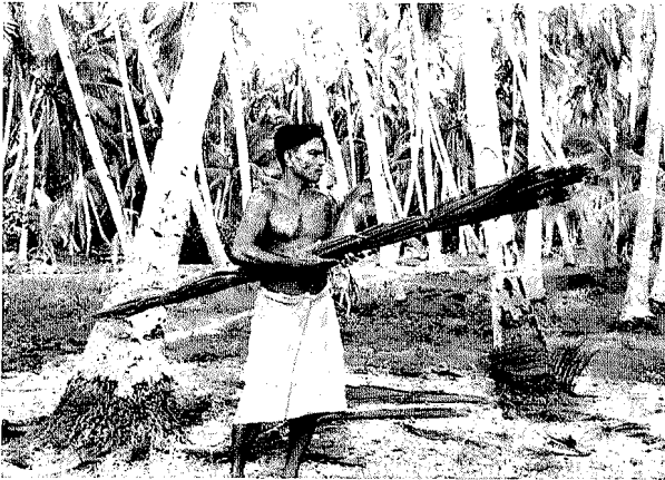
Abb. 4. Abbrennen einer Fackel

Nachdem der Mann, in Richtung auf die Blattenden arbeitend, die beiden welken Blätter mit drei weiteren Wicklungen vereint hat, legt er ihre Endpartien um und befestigt sie in gleicher Weise. Damit ist die Fackel (in einfacher Weise gewickelt, also nicht geflochten) fertiggestellt.