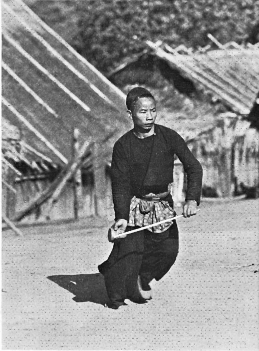
Abb. 3. Werfen des Spielkreisels

freien Platz vor den Häusern. Sie tragen die volle Stammestracht mit quastengeschmückten Kappen und Silberschmuck; einer jedoch trägt statt der üblichen Knabenjacke ein weißes Hemd in europäischem Schnitt. In den Händen tragen sie ihre Holzkreisel mit den Peitschen, deren Schnüre um den oberen zylinderförmigen Teil der Spielkreisel gewickelt sind.