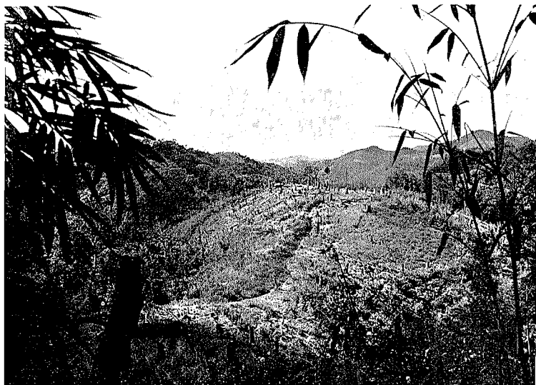
Abb. 2. Brandrodungsfeld der Miao

Chinesische Chroniken der Han-Dynastie (206 v. Chr. bis 221 n. Chr.) und insbesondere seit der Sung-Dynastie (960—1279 n. Chr.) nehmen des öfteren auf die Miao und andere südliche Randvölker Chinas Bezug, bezeichnen sie als „Wilde“ oder „Barbaren der Berge“ und belegen sie