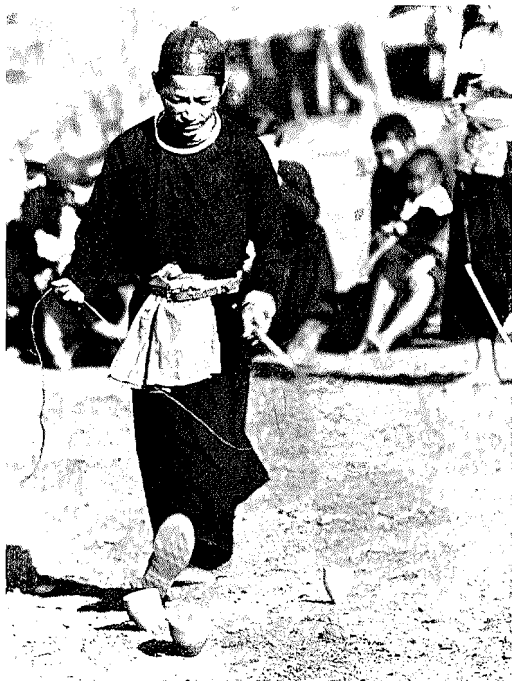
Abb. 4. Kreiselspiel

zu Fall zu bringen oder aus der Bahn zu schleudern und ihre Kreisel an die Stelle der zuerst geschleuderten zu setzen. Gelingt diese Absicht, dann haben die Werfer gewonnen. Treffen die Werfer jedoch einen Standkreisel, ohne daß dieser umfällt, so erhöht sich die Spannung noch, denn es kommt jetzt darauf an, wessen Kreisel am längsten läuft.