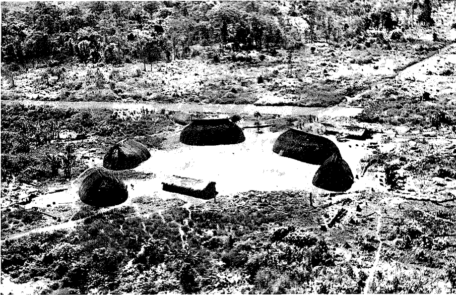
Abb. 1. Luftaufnahme des Waurá-Dorfes (1964)

zung. Wie bei den meisten Xingú-Stämmen ist die Jagd dagegen von geringerer Bedeutung; wir wissen jedoch nicht, inwieweit das Fleisch wildlebender Tiere aus religiösen Motiven gemieden wird. Auf jeden Fall werden Vögel häufiger verspeist als Säugetiere, welche offensichtlich gemieden werden.