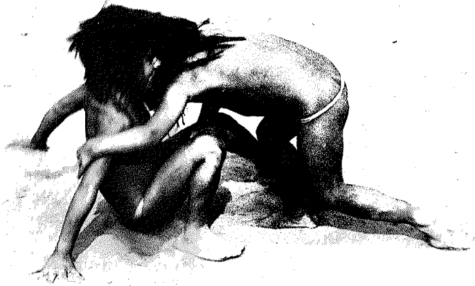
Abb.3. Die kleineren Mädchen ringen nach der sapalakú -Zeremonie als erste. Während die erwachsenen Frauen die Männerringkämpfe mehr spaßhaft nachahmen, nehmen sie den Kampf ernster und führen ihn weit enthusiastischer

der Zeremonie einen Kopfschmuck aus gelben Federn. Sich wie ein Mann zu verhalten, ist eine rituelle Umkehrung. Durch diese werden die Frauen als aktives Element in das Zeremonialleben einbezogen. So wie Kopfschmuck, Ringen u.ä. Zeichen für Häuptlingschaft bei den Waurá wie auch bei anderen Xingú-Stämmen