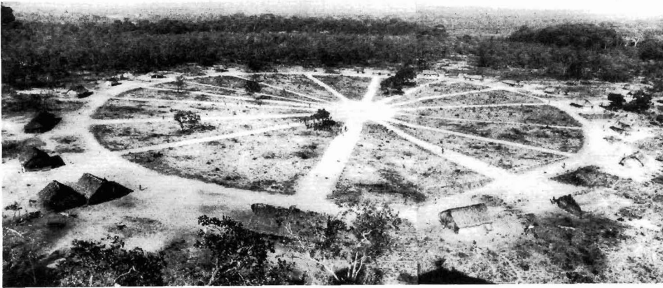
Abb. 1. Das Krahó-Dorf Pedra Branca im Jahre 1965. Die Häuser sind kreisförmig um einen zentralen Platz angeordnet

Die Krahó sind traditionsgemäß Jäger, doch das Eindringen der Weißen und die allgemeine Verbreitung von Schußwaffen haben den Bestand der Wildtiere in einem so starken Ausmaß verringert, daß größeres Wild, wie Tapire, Rotwild und Wildschweine, in dem Indianergebiet und den angrenzenden Regionen selten geworden ist (Film E 437 [12]).