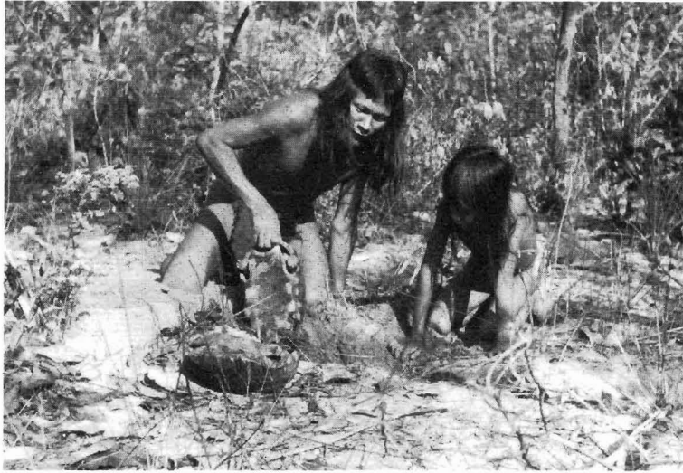
Abb.3. Mit Hilfe der hinterlassenen Spuren werden Landschildkröten in ihrem sommerlichen Versteck aufgestöbert und hervorgeholt

Zu den Beutetieren der Krahó gehören auch Landschildkröten ( Testudo tabulata ). Während des Sommers, wenn kein Regen fällt und die Savanne trocken ist, verbergen sie sich in Gruppen von zwei bis vier, manchmal auch zu fünft, für mehrere Monate in Löchern im Boden. Die Indianer können sie aufgrund der Spuren, die sie im Sand hinterlassen haben, aufstöbern. Wenn die Männer eine gemeinschaftliche Unternehmung zum Sammeln von Früchten organisiert haben, verbinden sie diese