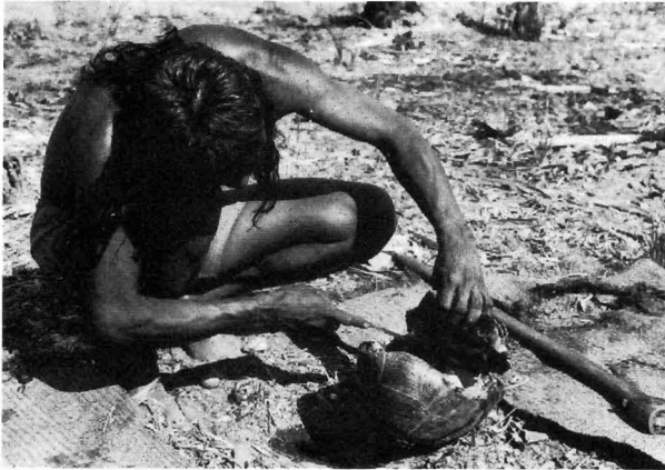
Abb.4. Im Dorf wird eine Schildkröte zubereitet. Der Bauchpanzer ist mit der Axt vom Rückenpanzer getrennt worden und wird mit dem Messer gerade endgültig von Muskeln und Fleisch abgelöst, bevor die Schildkröte ausgenommen und mit Maniok gefüllt im Erdofen gedünstet wird

Die Spuren der Landschildkröten waren einige Stunden vor den Filmaufnahmen gefunden worden. Die Indianer berichteten uns davon, weil sie wußten, daß wir das Sammeln und Zubereiten von Schildkröten gern sehen und filmen würden. Sie führten uns zu der Stelle, wo sie die Spuren ausgemacht hatten, und fingen dann die Tiere so, wie sie es üblicherweise tun. Während unseres zweimonatigen Aufenthaltes war dies das einzige Mal, daß die Kraho Schildkröten aufstöberten.