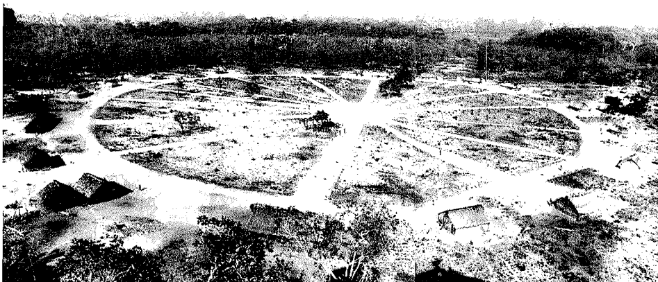
Abb. 1. Das Krahó-Dorf Pedra Branca im Jahre 1965. Die Häuser sind kreisförmig um einen zentralen Platz angeordnet

Die Namen der Dörfer werden von ihrer Lage und Umgebung bestimmt. So erhielt beispielsweise das Dorf Cachoeira seinen Namen von dem nahe gelegenen Wasserfall ( cachoeira = Wasserfall). Morro do Boi ist der Name einer Meseta (erodierter Hügel), während die anderen Dorfbezeichnungen identisch mit den Namen kleiner Flüsse sind. Wenn die Dörfer verlegt werden, was öfter geschieht, ändern sich häufig ihre Namen.