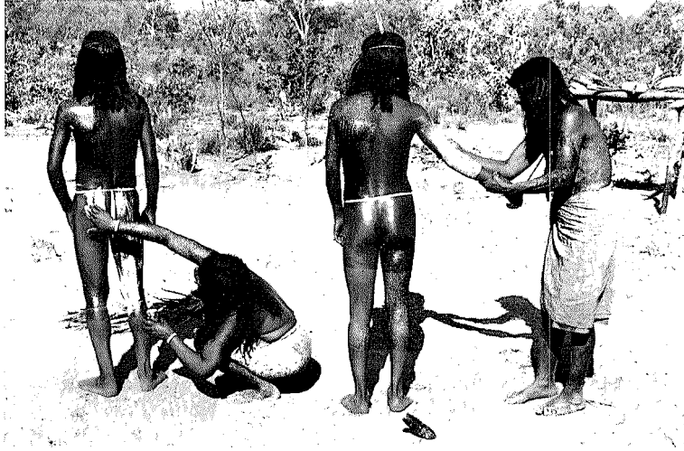
Abb. 3. Milchig weißer Saft eines Buschsteppenbaumes wird als klebrige Unterlage für die schwarze Farbe (Holzkohle) auf bestimmte Flächen des Körpers aufgetragen