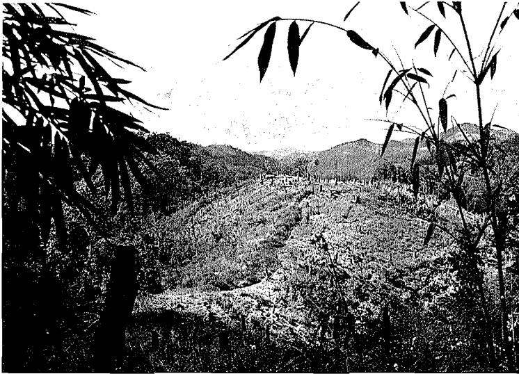
Abb. 2. Brandrodungsfeld der Miao

des öfteren auf die Miao und andere südliche Randvölker Chinas Bezug, bezeichnen sie als „Wilde“ oder „Barbaren der Berge“ und belegen sie mit den üblichen herabwürdigenden Namen (BERNATZIK [56], SAVINA [69]). Aus historischen Quellen ebenso wie aus ethnologischen, lingu-