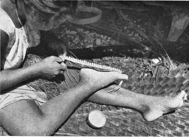
Abb. 3. Frau von Nonouti beim Anfertigen des Kopfschmuckes mae te ningoningo : Seeschneckengehäuse werden auf Pandanus-Blattstreifen geheftet

präparierter Faserhüllen (KOCH [55]) der Kokosnuß löst sie jeweils vier oder fünf Fasern und dreht diese zwischen Daumen und Zeigefinger zu einem kleinen Strang ( binoka ). Diese Stränge vereint sie paarweise, in der Länge unterschiedlich gegeneinander gelegt, zu einer dünnen Kokosfaserschnur ( kora ), indem sie die binoka auf ihrem Obersehenkel mit der flachen Rechten zusammenrollt und an die auslaufenden Stränge jeweils neue andreht.