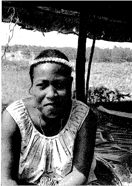
Abb. 4. Tragweise des fertigen Kopfschmuckes mae te ningoningo . Nonouti

kengelhäuse auf und gibt die Schnur wieder durch das Band, so daß dieses mit einer Reihe dicht nebeneinanderliegender ningoningo besetzt wird. Nachdem das Band bis zum Beginn des Endgeflechtes (Bindepartie des Kopfschmuckes) besetzt ist, befestigt Tikobia die Heftschnur durch Verknoten und beißt sie dann ab.