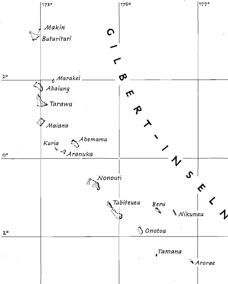
Abb. 2. Der Archipel der Gilbert-Inseln

Auf den südlichen Atollen des Archipels gab es kein Häuptlingstum. Die patrilokalen, patrilinearen, exogamen und totemistisch bestimmten Familienverbände, geführt von den alten Männern bzw. Sippenhäuptern, waren die größten politisch und wirtschaftlich autarken Einheiten.