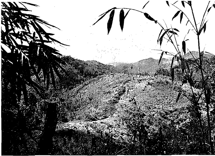
Abb. 2. Brandrodungsfeld der Miao

Chinesische Chroniken der Han-Dynastie (206 v. Chr. bis 221 n. Chr.) und insbesondere seit der Sung-Dynastie (960—1279 n. Chr.) nehmen des öfteren auf die Miao und andere südliche Randvölker Chinas Bezug, bezeichnen sie als „Wilde“ oder „Barbaren der Berge“ und belegen sie