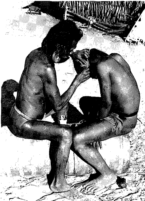
Abb. 4. In den Tagen nach dem Durchstechen der Ohrläppchen werden anstelle der vorigen täglich neue Stöckchen in die Löcher eingeschoben, um ein Zusammenwachsen der Wundränder zu verhindern

Die Aufnahmen zu dem vorliegenden Film entstanden im Dorf Pedra Branca zwischen August und Oktober 1965, während HARALD SCHULTZ sich zum wiederholten und letzten Mal zu Forschungen bei den Krahó aufhielt. Sie wurden mit einer Bolex-Kamera auf 16-mm-Farbumkehrfilm Eastman Ektachrome Commercial durchgeführt.