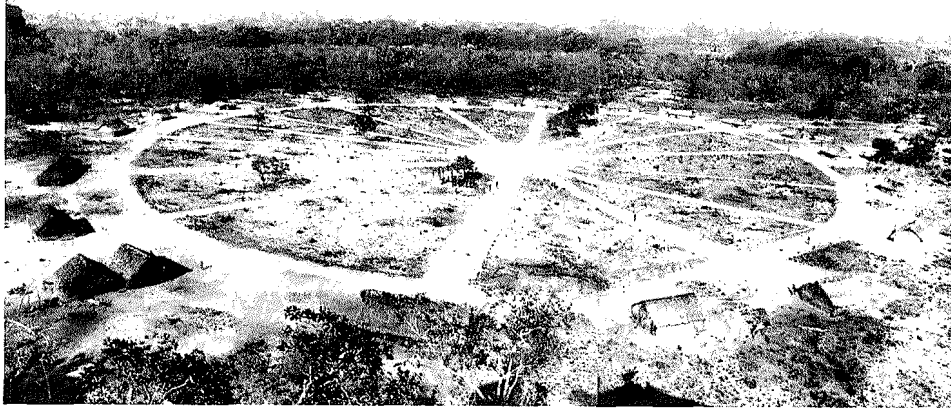
Abb. 1. Das Krahó-Dorf Pedra Branca im Jahre 1965. Die Häuser sind kreisförmig um einen zentralen Platz angeordnet

Als die Indianer noch unabhängig waren, hatten sie speziell in den zwei Jahrzehnten zwischen 1920 und 1940 ihre Ernteerträge so gesteigert, daß sie den Überschuß in Carolina, einer 200 km weiter nördlich gelegenen Stadt, verkaufen konnten. Doch