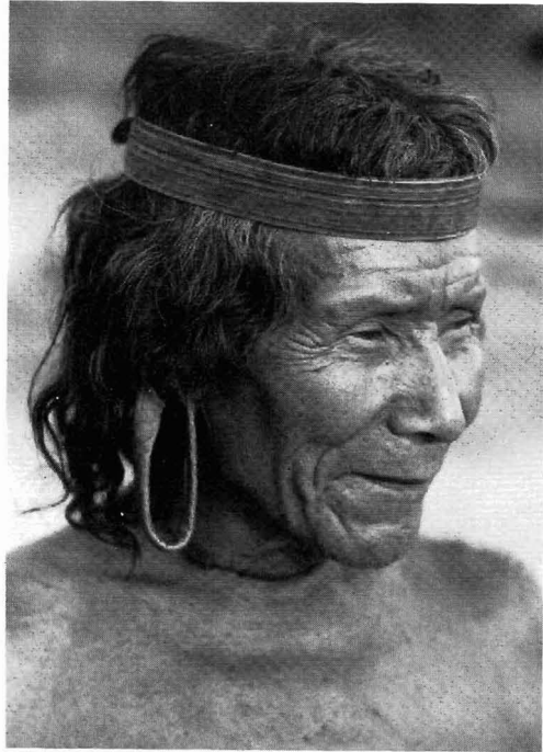
Abb. 3. Ein Kraho mit ausgeweiteten Ohrläppchen ohne Ohrscheiben und typischem Kopfschmuck aus einem Palmblattstreifen

Zu zeremoniellen Ereignissen werden die Scheiben sorgfältig bemalt und verziert, vornehmlich mit weißem Ton als Grundfarbe und schwarzen Linien und Punkten darauf. Doch haben wir nicht den Eindruck gewonnen, daß Größe, geschnitzte Verzierungen, Farbe oder Muster der Ohrscheiben mit den Stammeshälften oder irgend-