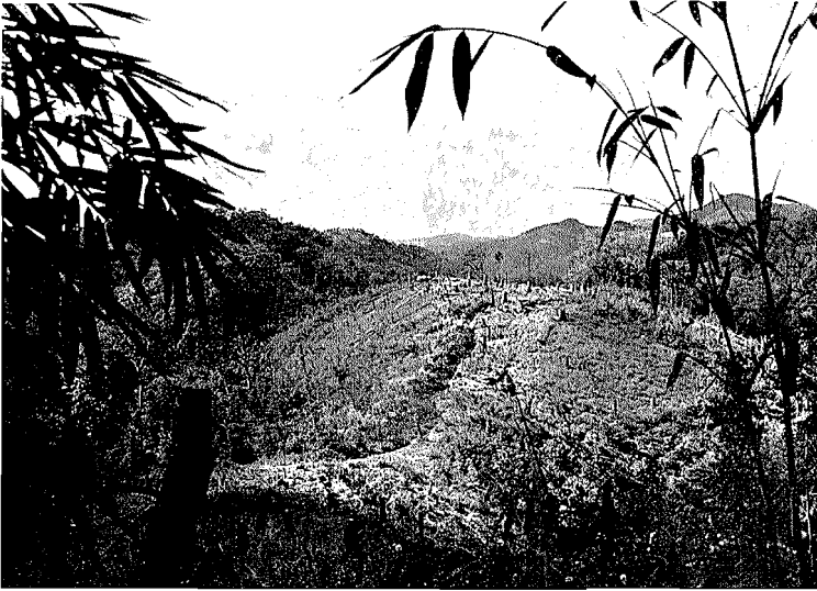
Abb. 2. Brandrodungsfeld der Miao

des öfteren auf die Miao und andere südliche Randvölker Chinas Bezug, bezeichnen sie als „Wilde“ oder „Barbaren der Berge“ und belegen sie mit den üblichen herabwürdigenden Namen (BERNATZIK [56], SAVINA [69]). Aus historischen Quellen ebenso wie aus ethnologischen, linguistischen und rassischen Evidenzen ist zu entnehmen, daß das Ursprungsland der Miao wohl in Gebieten des südöstlichen China zu suchen ist. Dort leisteten sie schon in vorchristlicher Zeit hartnäckigen Widerstand