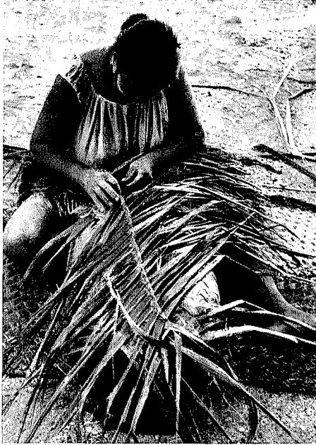
Abb. 3. Frau von Tabiteuca beim Flechten eines Lastenkorbes ( baene )

Die Frau nimmt dann die beiden Enden des Werkstücks auf, biegt sie zusammen, zieht ein Fiederblatt von einer der beiden Seiten durch das obere Randende der anderen, schiebt und zieht die Partien enger zusammen und beginnt dann, sie zusammenzuflechten, um die durchgehende Wandung des Korbes zu erzielen. Sie flicht in der üblichen