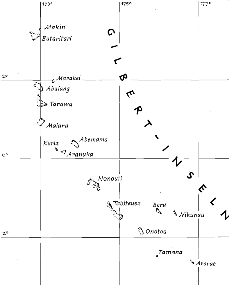
Abb. 2. Der Archipel der Gilbert-Inseln

Auf den südlichen Atollen des Archipels gab es kein Häuptlingstum. Die patrilokalen, patrilinearen, exogamen und totemistisch bestimmten Familienverbände, geführt von den alten Männern bzw. Sippenhäuptern, waren die größten politisch und wirtschaftlich autarken Einheiten.