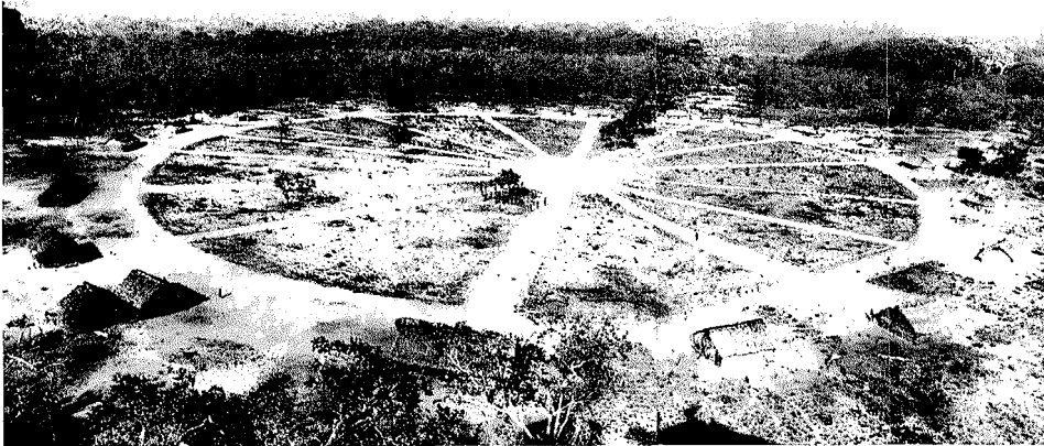
Abb. 1. Das Kraho-Dorf Pedra Branca im Jahre 1965. Die Häuser sind kreisförmig um einen zentralen Platz angeordnet

Die Kraho sind traditionsgemäß Jäger, doch das Eindringen der Weißen und die allgemeine Verbreitung von Schußwaffen haben den Bestand der Wildtiere in einem so starken Ausmaß verringert, daß größeres Wild, wie Tapire, Rotwild und Wildschweine, in dem Indianergebiet und den angrenzenden Regionen selten geworden ist (Film E 437 [12]).